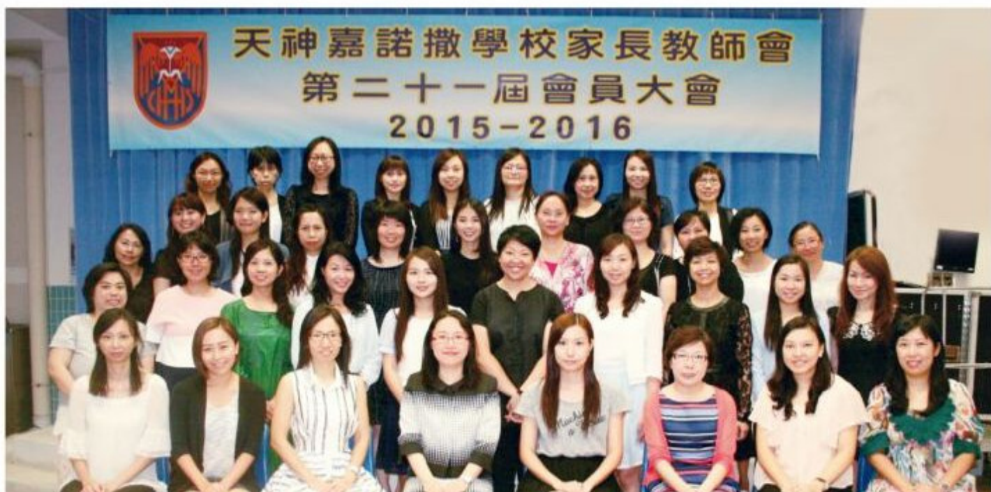
家長教師會委員暨全體老師 (2015-16年度)